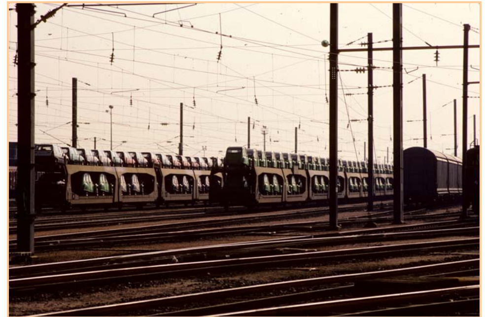
Train de 2CV en gare de COLMAR en 1987