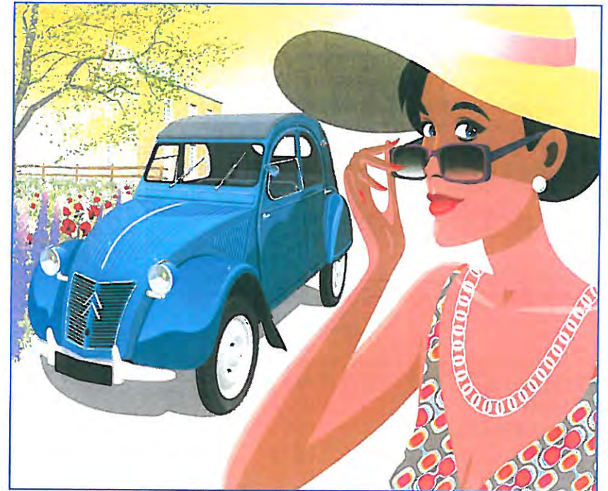
Illustration Olivier BREAUD