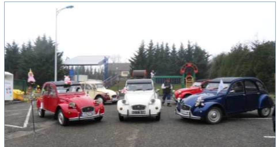
STEIN 'PAQUES le 30 mars 2013 à Steinbach

SSSSSSSSSSSSSSSSSSSSSSSSSSSSSSSSSSSS PROCHAINE REUNION VENDREDI 17 MAI 2013