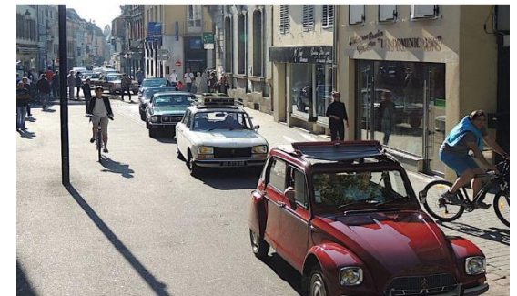
Rassemblement 4ème Dimanche à Guebwiller

Le Nez dans L'O 71 Rue de la République 68500 GUEBWILLER Tél 0771749194 dimanche4.nezdanslo@gmail.com