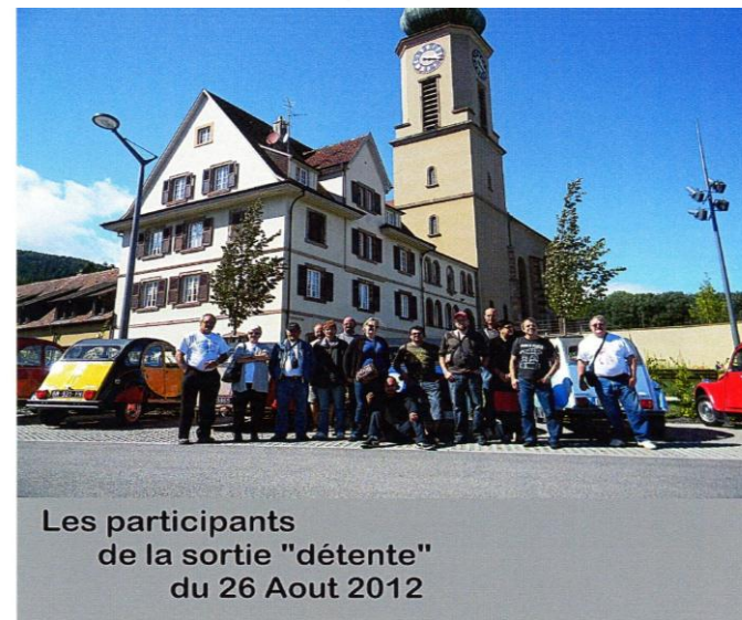
Les participants de la sortie "détente" du 26 Aout 2012