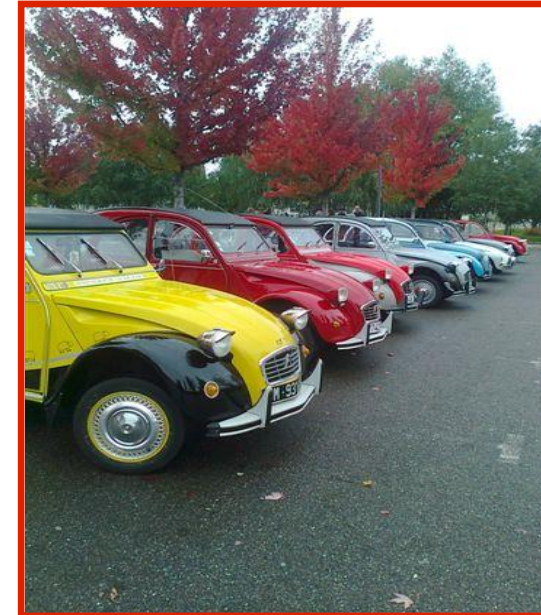
Sortie Vendanges le 14 octobre 2012