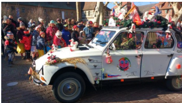
C'est la période des carnivals !