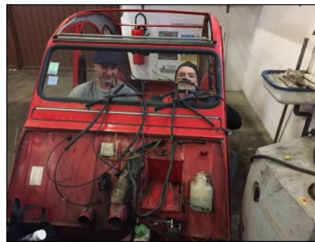
Forcement , elle va marcher moins bien maintenant !